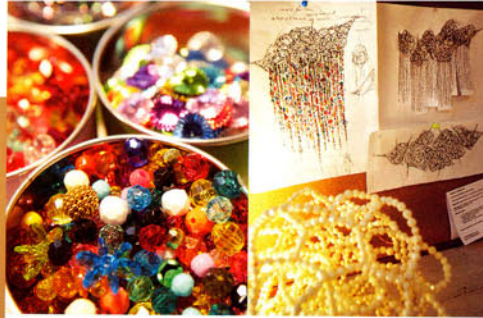
ニューヨークのハモンド美術館で催された「月の都 Metropole of the Moon」展より 1 "Spiral Shell Unicorn Horn 001" (18×14×9inch) 2004年 素材 : plastic beads & copper wire 2 "Spiral Shell Unicorn Horn 003" (14×12×10inch) 2004年 素材 : plastic beads & copper wire